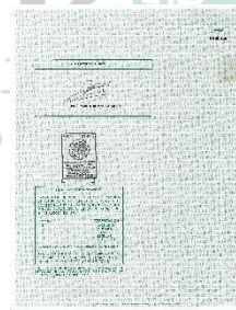
15082013 CERT_BACH (2)