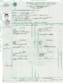
150820313 CERT_BACH (1)